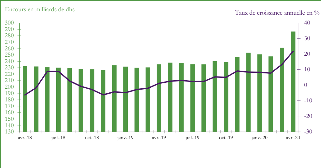
Graphique 3 : EVOLUTION DES AVOIRS OFFICIELS DE RESERVE